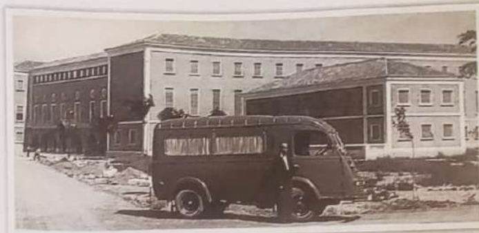
Una furgoneta, delante de la fachada del colegio en sus primeros años de vida.

Este arquitecto palentino no pone freno a la hora de aportar ideas brillantes susceptibles de ser consideradas por parte de las administraciones locales, como