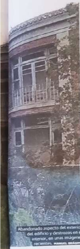
Abandonado aspecto del exterior del edificio y destrozos en el interior, en unas imágenes recientes. MANUEL BRAGIMO

denencia temporal para artistas y estudiantes durante las temporadas de los cursos que se impartirían, «con lo que se rescataría parte del antiguo uso que tuvo este edificio de residencia de huérfanos ferroviarios». Y añade: «Las residencias contribuyen a la mejora de la cohesión social, generan entornos de conocimiento y confianza, refuerzan el sentimiento de pertenencia y el compromiso de la comunidad, favoreciendo el diálogo intercultural, la regeneración urbana y la promoción de su territorio como un lugar creativo, dinámico y comprometido con la cultura».